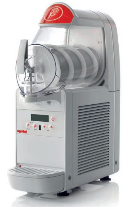
Für die optimale Textur muss das Eis ständig gerührt werden.

deren Qualität und Haltbarkeit in zahllosen Testläufen und Serieneinsätzen nachgewiesen sind“, macht Hagedorn deutlich. In der ersten Stufe, dort trifft die hohe Drehzahl des Elektromotors direkt auf das Getriebe, sorgen nun duktile Planetenräder aus Kunststoff für die erste Untersetzung bei noch geringem Drehmoment. Dies minimiert das Geräuschniveau spürbar. „Die genaue Umsetzung der Verzahnung in dieser Stufe basiert auf der jahrzehntelangen Erfahrung von IMS Gear, gepaart mit modernsten Simulationsberechnungen“, betont Hagedorn. In der zweiten und dritten Stufe wandeln dann gerade verzahnte Metallräder die Drehzahl in das benötigte Drehmoment um. Diese Räder sind durch eine spezielle Lagertechnologie