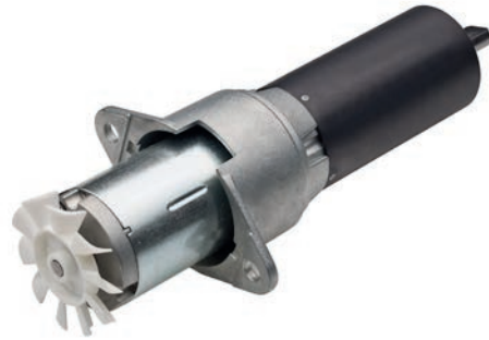
Dieses PM 52 ist eine der Getriebevarianten die in den Eismaschinen zu finden sind.